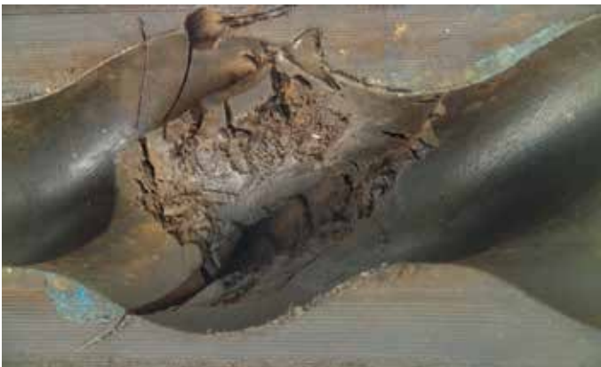
Ausfall nach ca. 3.000 Stunden durch Ablösung von Statorteilen