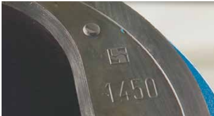
Allweiler® Logo Angabe der Baugröße