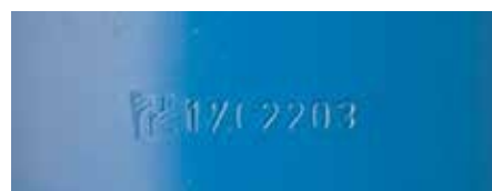
Individuelle Kennziffer im Statormantel