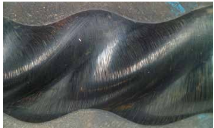
Nahezu abnutzungsfrei bei gleichen Betriebsbedingungen