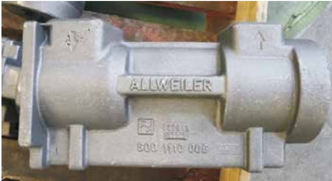
Allweiler® Logo und Schriftzug