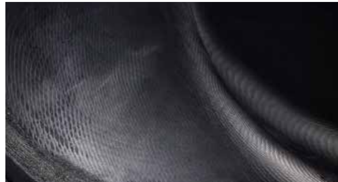
Spezielle wabenförmige Elastomeroberfläche